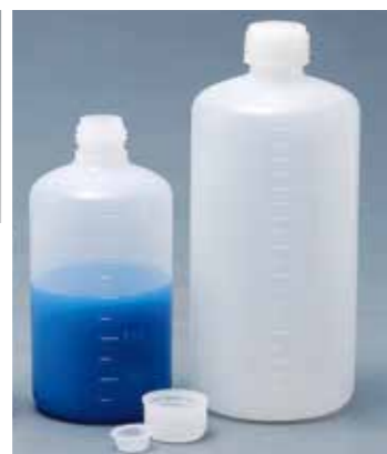
キャップの使用例