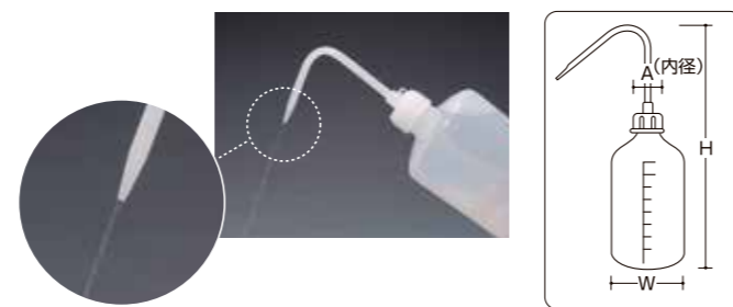
ポリ洗浄瓶 ※価格は全てオープン価格です。