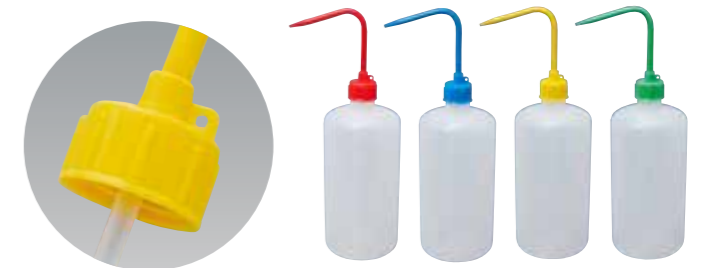
オプションノズル装着例